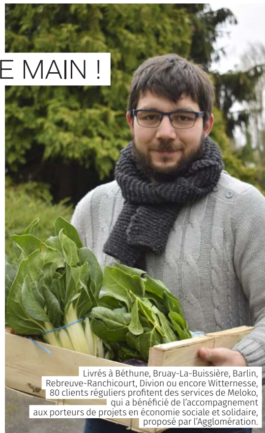
Livrés à Béthune, Bruay-La-Buissière, Barlin, Rebreuve-Ranchicourt, Divion ou encore Witternesse, 80 clients réguliers profitent des services de Meloko, qui a bénéficié de l'accompagnement aux porteurs de projets en économie sociale et solidaire, proposé par l'Agglomération.