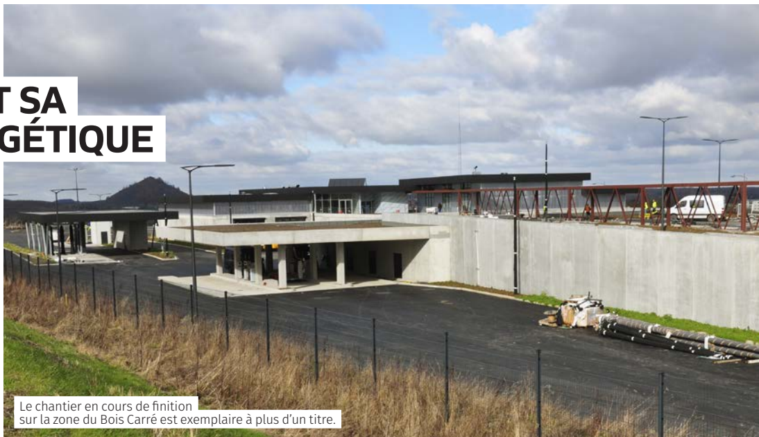
Le chantier en cours de finition sur la zone du Bois Carré est exemplaire à plus d'un titre.