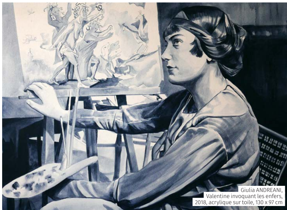
Giulia ANDREANI, Valentine invoquant les enfers, 2018, acrylique sur toile, 130 x 97 cm