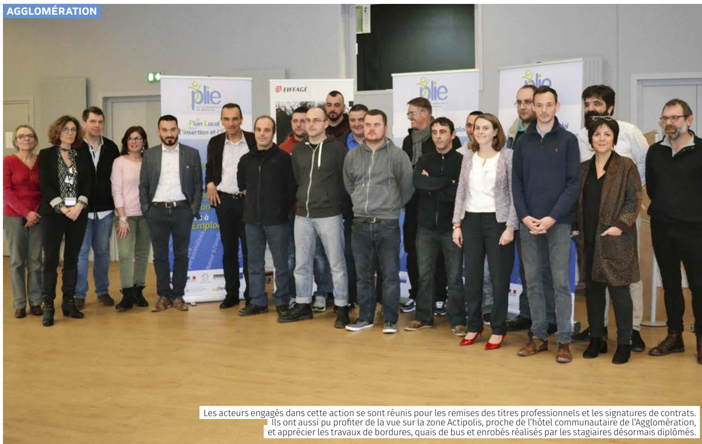
Les acteurs engagés dans cette action se sont réunis pour les remises des titres professionnels et les signatures de contrats. Ils ont aussi pu profiter de la vue sur la zone Actipolis, proche de l'hôtel communautaire de l'Agglomération, et apprécier les travaux de bordures, quais de bus et enrobés réalisés par les stagiaires désormais diplômés.