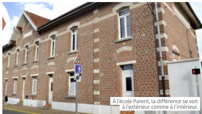
À l'école Parent, la différence se voit à l'extérieur comme à l'intérieur.

Le coût total de l'opération est de 434 800 € (hors taxes), l'Agglomération en apportant 136 420 € ; plus que l'accoutumée puisque cet équipement est situé dans un « quartier prioritaire de la politique de la ville ». On notera aussi que 446 heures d'insertion ont été proposées à des personnes éloignées de l'emploi.