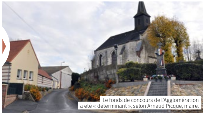
Le fonds de concours de l'Agglomération a été « déterminant », selon Arnaud Picque, maire.

Un projet de 68 394 € qui bénéficie d'une aide communautaire de 22 938 € .