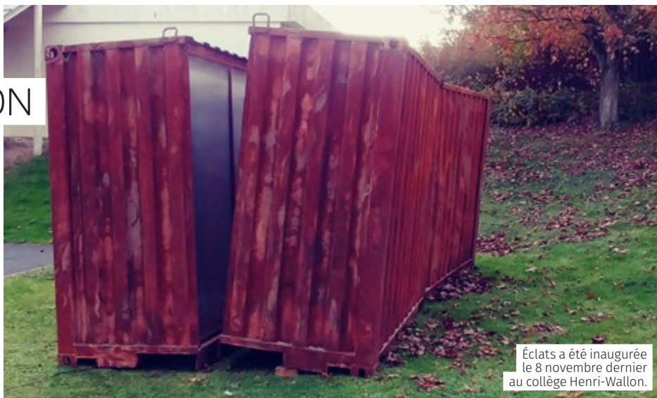
Éclats a été inaugurée le 8 novembre dernier au collège Henri-Wallon.

E n effet, après Ligne de Front, Éclats a continué son chemin sur notre territoire et a investi successivement les collèges Anatole-France de Nœux-les-Mines et Léo-Lagrange de Lillers. Elle est donc aujourd'hui au collège Henri-Wallon, pour une action de médiation culturelle.