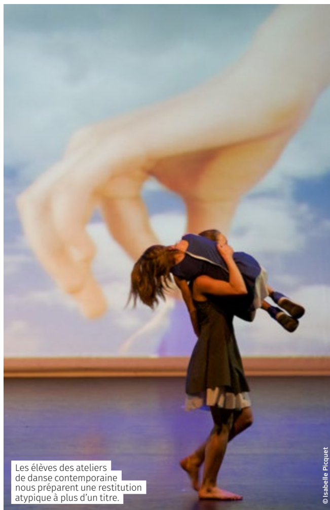
Les élèves des ateliers de danse contemporaine nous préparent une restitution atypique à plus d'un titre.

> Réservations au 06 42 25 81 12 par sms ou conservatoire.danse.bruay@bethunebruay.fr