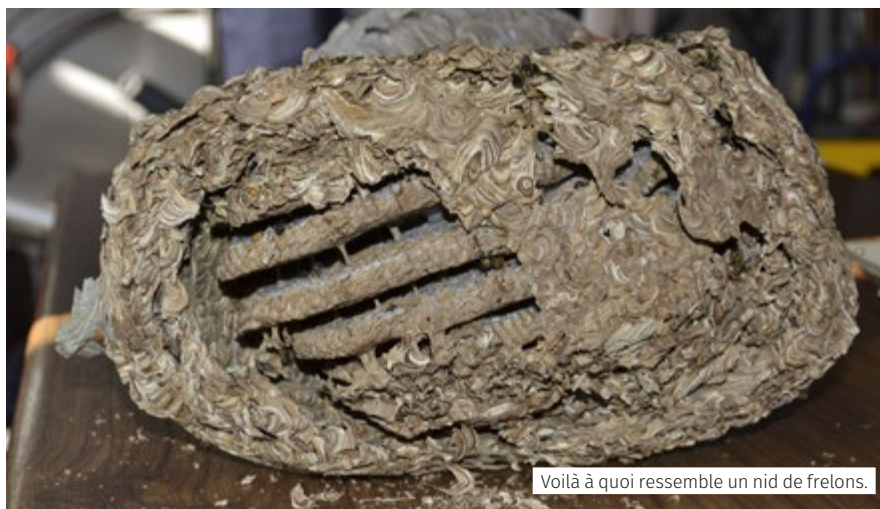
Voilà à quoi ressemble un nid de frelons.

Les habitants des communes de l'ex-Artois Comm. peuvent bénéficier de ce service. L'harmonisation des compétences à la suite de la fusion n'étant pas encore achevée, les habitants des communes des anciennes communautés Artois-Lys et Artois Flandres doivent, eux, faire appel à une société privée (l'intervention est, dans ce cas, payante).