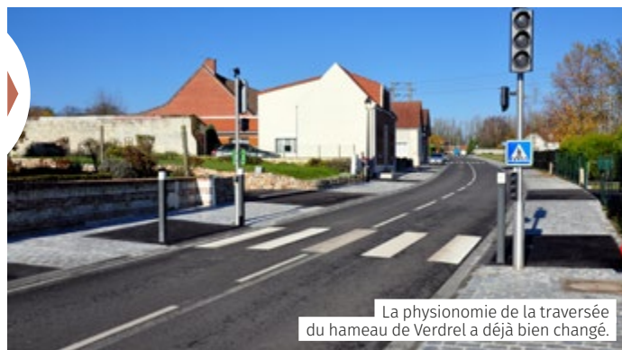
La physionomie de la traversée du hameau de Verdrel a déjà bien changé.

L'Agglomération apporte un concours de 115 927 € à ce chantier d'un coût de 785 927 €.