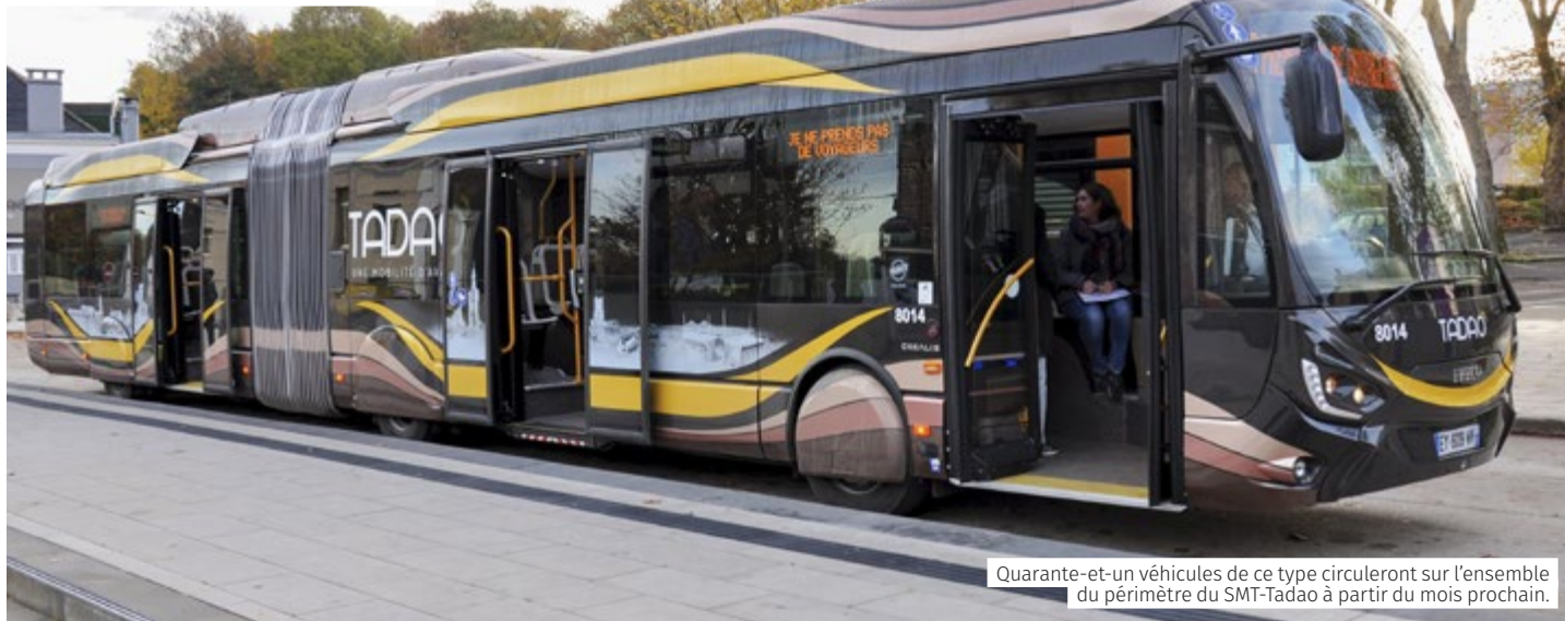
Quarante-et-un véhicules de ce type circuleront sur l'ensemble du périmètre du SMT-Tadao à partir du mois prochain.

C'est un grand, un énorme projet qui se concrétise : début 2019, après des années d'études et de travaux, le bus à haut niveau de service (BHNS), ici appelé les « Bulles », va prendre la route pour tous. Bienvenue à bord en avant-première !