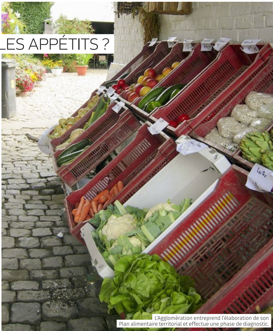
L'Agglomération entreprend l'élaboration de son Plan alimentaire territorial et effectue une phase de diagnostic.

Consommer local et de saison est bénéfique pour la santé et l'environnement. Sachant que 30 % des exploitants du territoire pratiquent la vente directe (circuits directs), une offre existe et pourrait encore se développer. En plus de répondre aux attentes du consommateur, il apparaît essentiel que la restauration collective bénéficie aussi de produits de qualité et de proximité. Les premiers visés seront